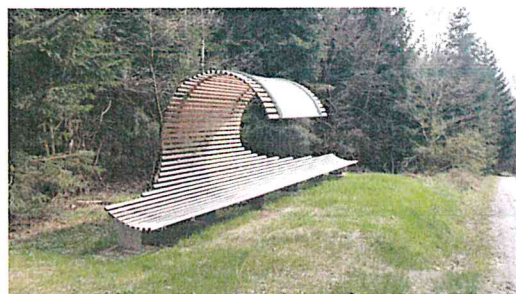
„back to the bench“

Lunchpaket für unterwegs EUR 8,50 pro Stück